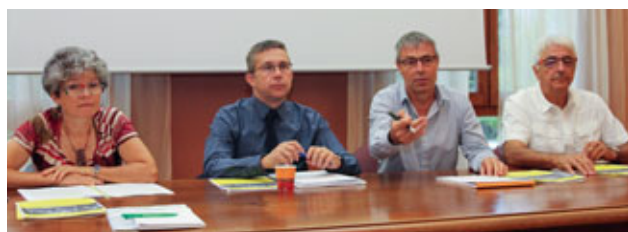
Conférence de presse en mairie

Depuis l'an 2000, la loi relative à la solidarité et au renouvellement urbain (SRU) impose aux communes de plus de 3 500 habitants (comprises dans une agglomération de plus de 50 000 habitants) de disposer d'au moins 20% de logements sociaux. Ce taux a été porté à 25%, à atteindre en 2025, par la « loi Duflot. » Les communes qui n'atteignent pas ce seuil doivent payer une contribution et s'engager dans un plan de rattrapage. Le taux peut également connaître des dérogations suivant la situation des communes. Ainsi, l'État a rabaisé le taux de la loi SRU de 25 à 20% pour les communes situées hors agglomération urbaine, ce qui est le cas de Vaulnaveys-le-Haut.