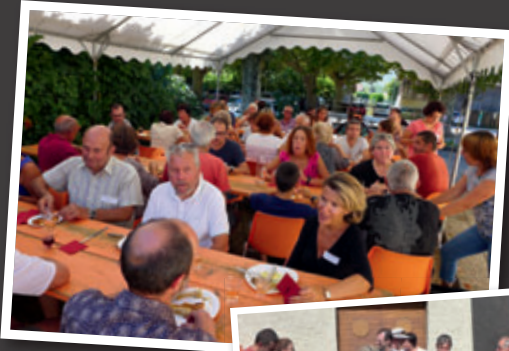
Le repas des bénévoles