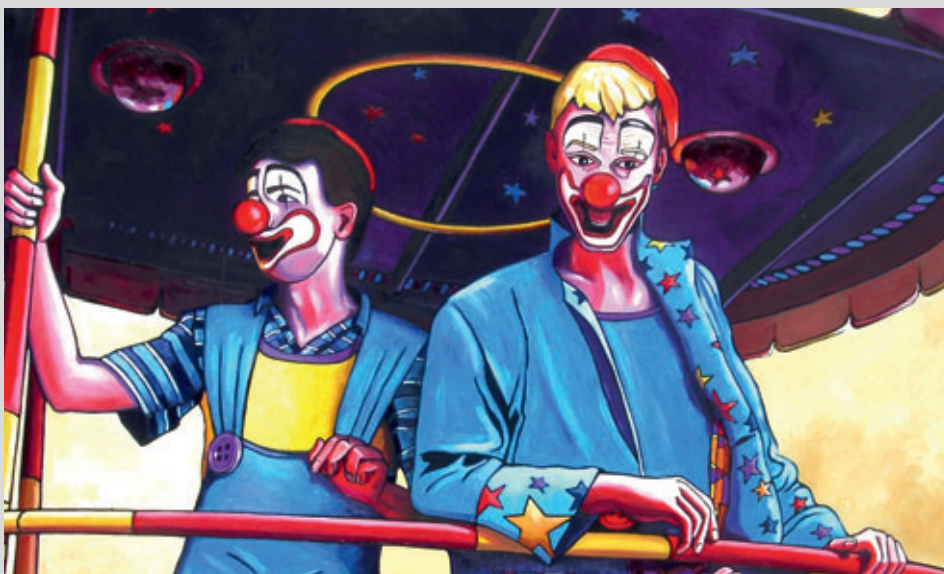
« Les clowns bleus » (figuratif)