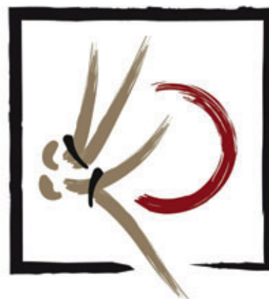
JUDO CLUB BELLEDONNE