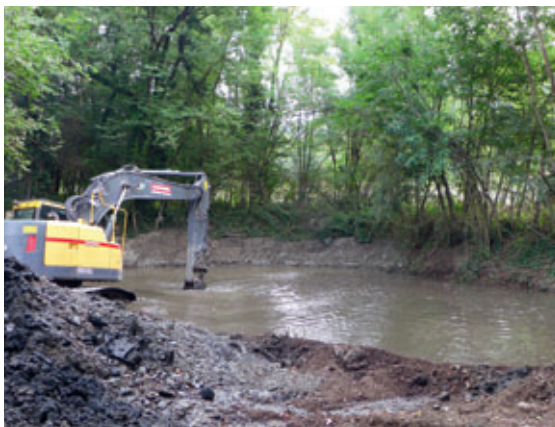
Travaux de curage de la plage de dépôt

Afin de protéger la population des risques d'inondation, la municipalité a réalisé des travaux sur le cours d'eau du Vernon. L'objectif est de garantir la sécurité des riverains en limitant les débordements dans la zone urbanisée. Deux sites ont donc fait l'objet de travaux :