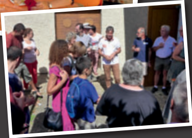
Discours du maire suivi du traditionnel pot de rentrée