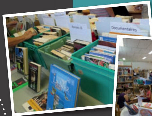
La bibliobradirie a permis de reverser 241,50€ à l'ONG Bibliothèques sans Frontières.