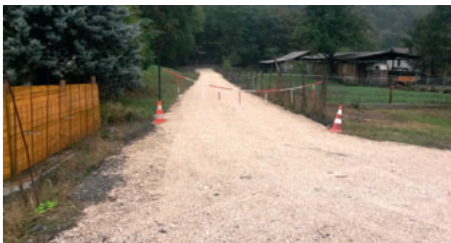
Chemin d'accès au piège à embâcles

Ces travaux d'importance ont été réalisés en partenariat avec le Contrat de rivière Drac Romanche, la CLE (Comité local de l'eau). Une subvention de 42% a été accordée par EDF CLE.