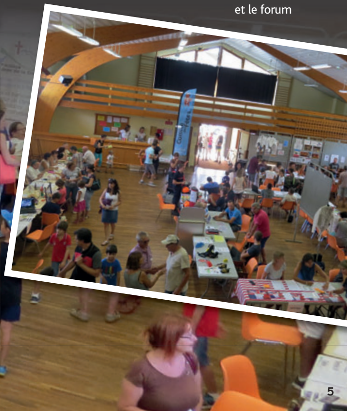
et le forum