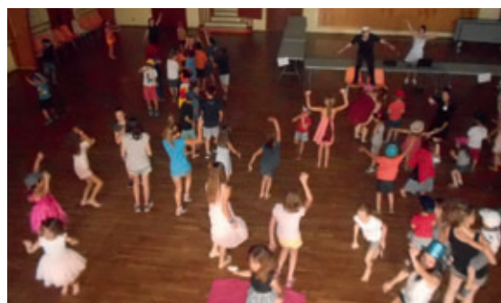
La « Big Boom » du centre de loisirs ! Un grand moment !

Les nuitées, innovation 2016, ont également fait le plein ! La première a eu lieu au stade de rugby avec au programme montage des tentes, préparations du repas buffet et barbecue, soirée jeux et