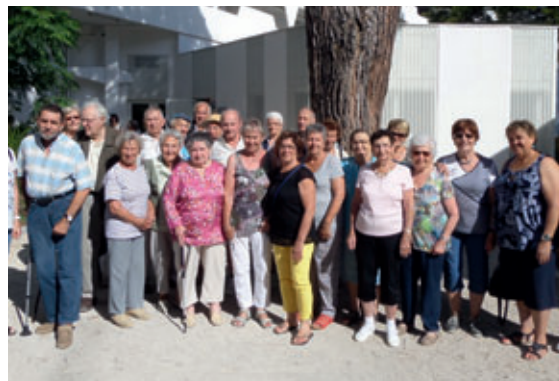
En juin 2016, deux Vaulnaviards sont partis à la Grande Motte avec des seniors des communes voisines.

L'année prochaine, le CCAS propose de découvrir les charmes de l'Alsace avec la destination de Mittelwihr. Ce séjour aura lieu du 10 au 17 septembre 2017. Les inscriptions sont d'ores et déjà ouvertes et se feront dans la limite des places disponibles.