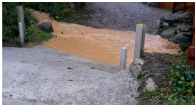
Reprofilage du passage à gué