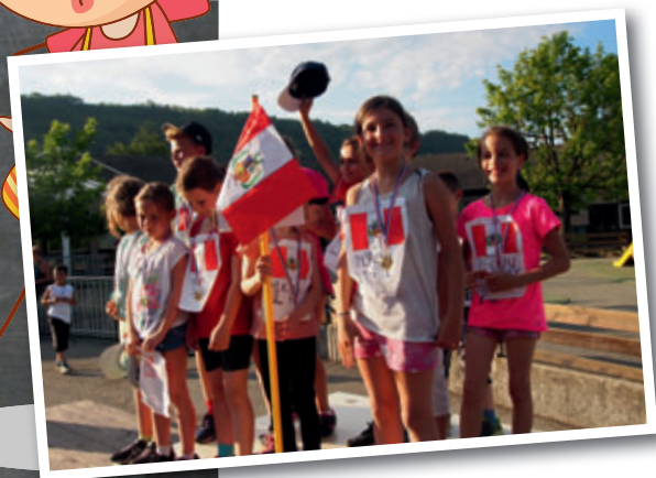
Le podium des Olympiades