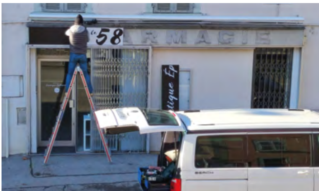
Pose de l'enseigne par la société « Sign up »