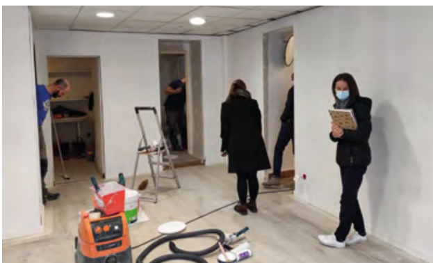
Réalisation des premiers travaux par la société « Je Le Fais Pour Vous »