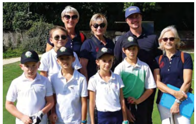
L'équipe et les élèves de l'école de Golf d'Uriage