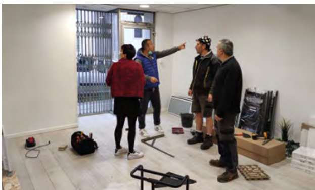
Travaux de finition et aménagement par les élus et les agents municipaux