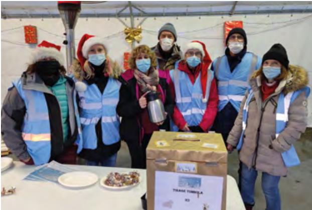
Les bénévoles du Comité des Fêtes