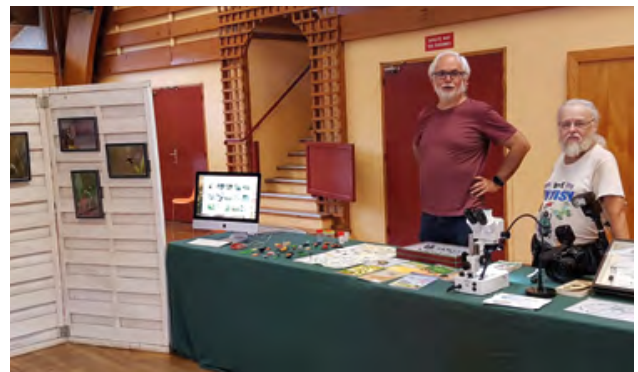
Le club d'entomologie « Rosalia »

Le COVID ne nous a heureusement pas empêchés de réfléchir. Il a fait germer un projet qui nous tenait à cœur : proposer une AMAP à Vaulnaveys. Après plusieurs échanges sur le sujet avec agriculteurs et familles intéressées, le projet avance et devrait se concrétiser au printemps.