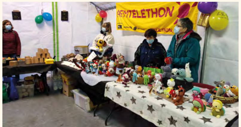
Le stand du Téléthon