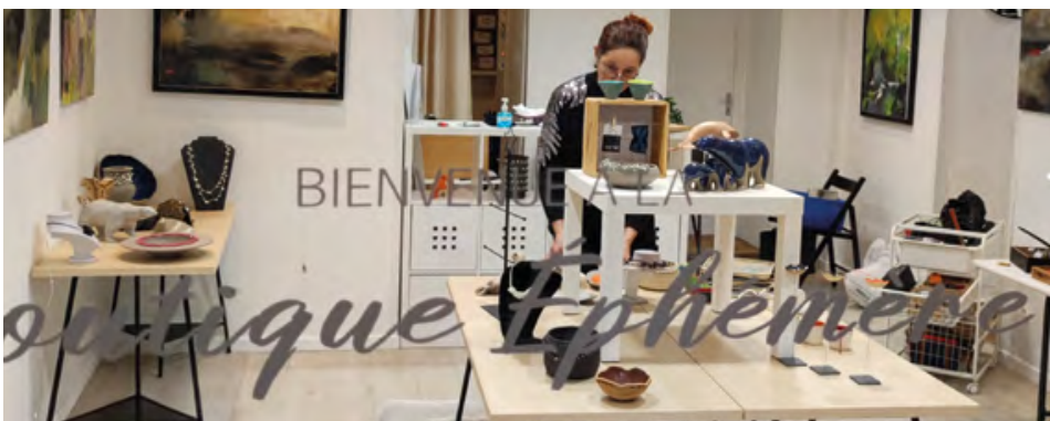
3 talents locaux ont occupé la boutique éphémère du 10 au 25 décembre 2021.

À partir de septembre 2021, les travaux démarrent et plusieurs entreprises locales interviennent :