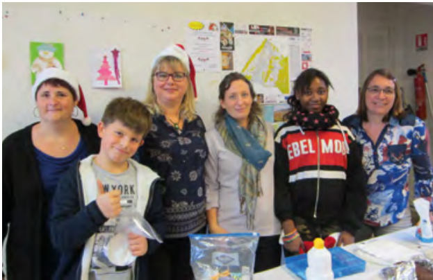
Les bénévoles de l'association « Faire & Grandir »

L'association propose habituellement quatre ateliers créatifs parents/enfants, à chaque saison de l'année. Cependant, la crise sanitaire et ses prolongements ne nous permettent pas d'organiser nos temps forts, comme nous le faisons traditionnellement, dans le partage et la joie des fêtes.