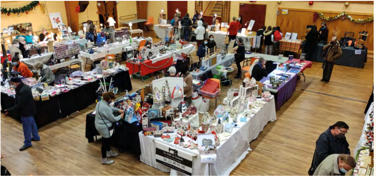
Les stands de la salle polyvalente