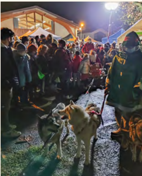
Le Père Noël avec ses lutins et ses chiens de traîneau