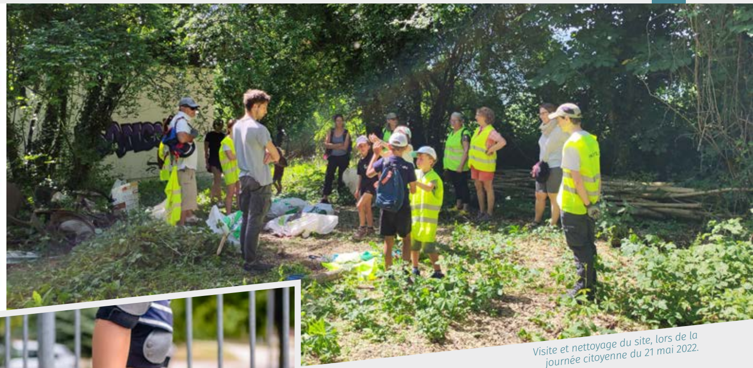
Visite et nettoyage du site, lors de la journée citoyenne du 21 mai 2022.