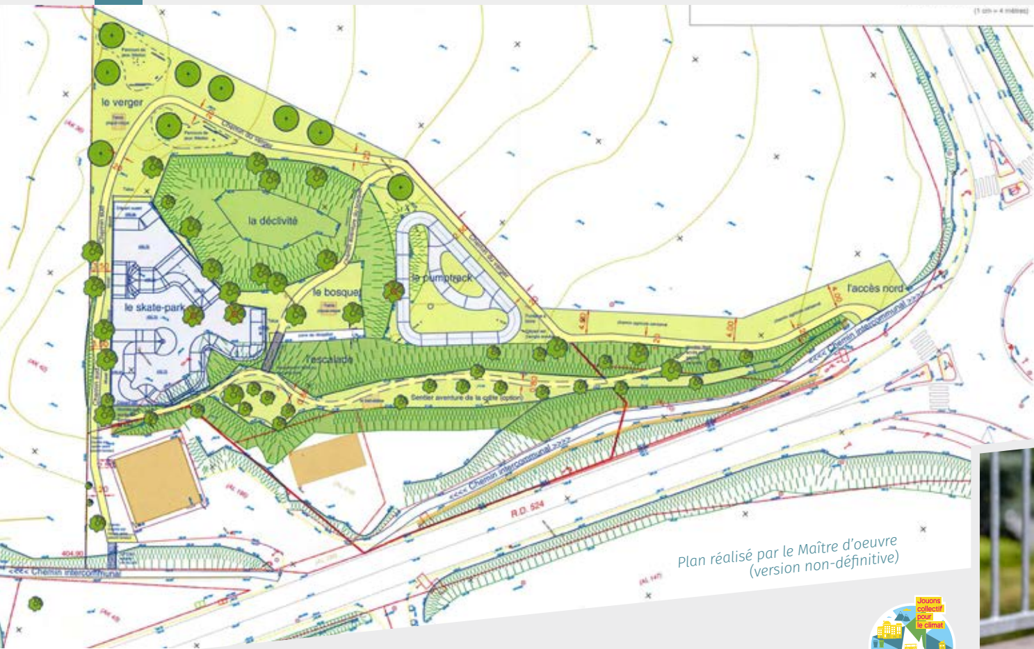
Plan réalisé par le Maître d'oeuvre (version non-définitive)